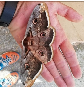
Gran Pavón Nocturno

Por cierto, si queréis saber mas cosillas de animales, plantas y rincones secretos. No dudéis en visitar mis paginas de Instagram y Facebook, si poneis animalesdemipueblo os saldré enseguida.