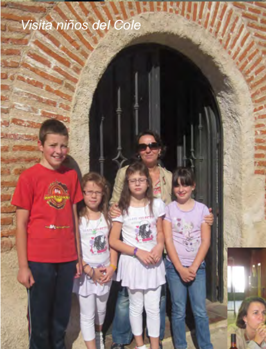
Visita niños del Cole