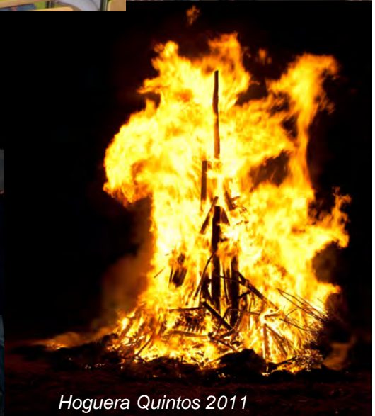
Hoguera Quintos 2011