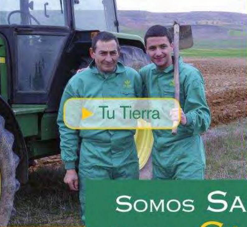
▶ Tu Tierra