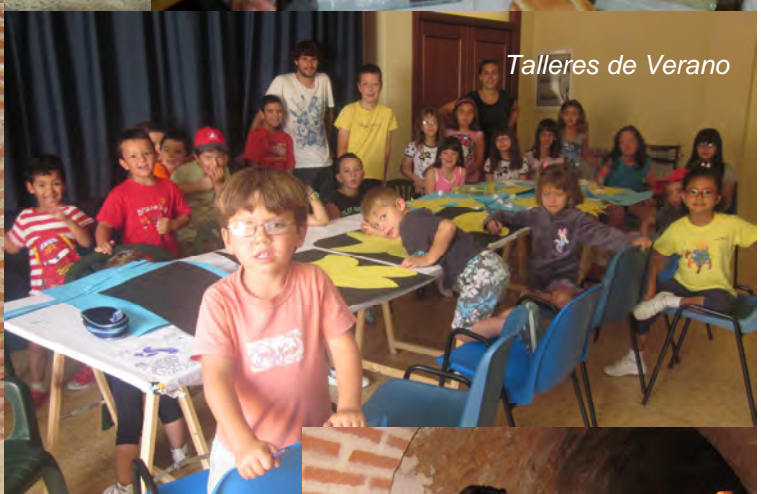
Talleres de Verano