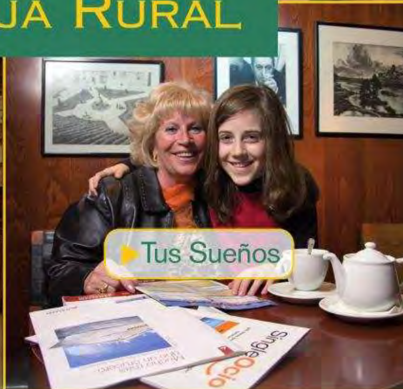
▶ Tus Sueños

▶ SOMOS SALAMANCA Y SU ÚNICA CAJA TOTALMENTE PROVINCIAL, CONCENTRANDO EN ELLA EL 100 % DE NUESTRA INVERSIÓN EN UNA APUESTA CLARA Y DECIDIDA POR SU BIENESTAR Y CRECIMIENTO, PORQUE CREEMOS FIRMEMENTE EN SU POTENCIAL Y NOS ILUSIONA SU FUTURO.