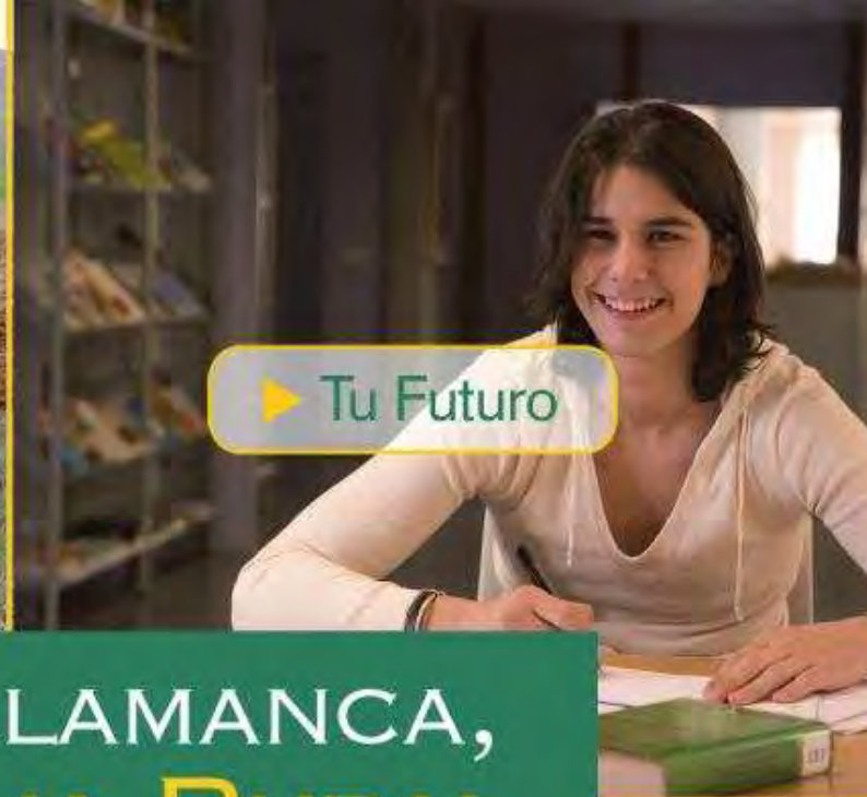
▶ Tu Futuro