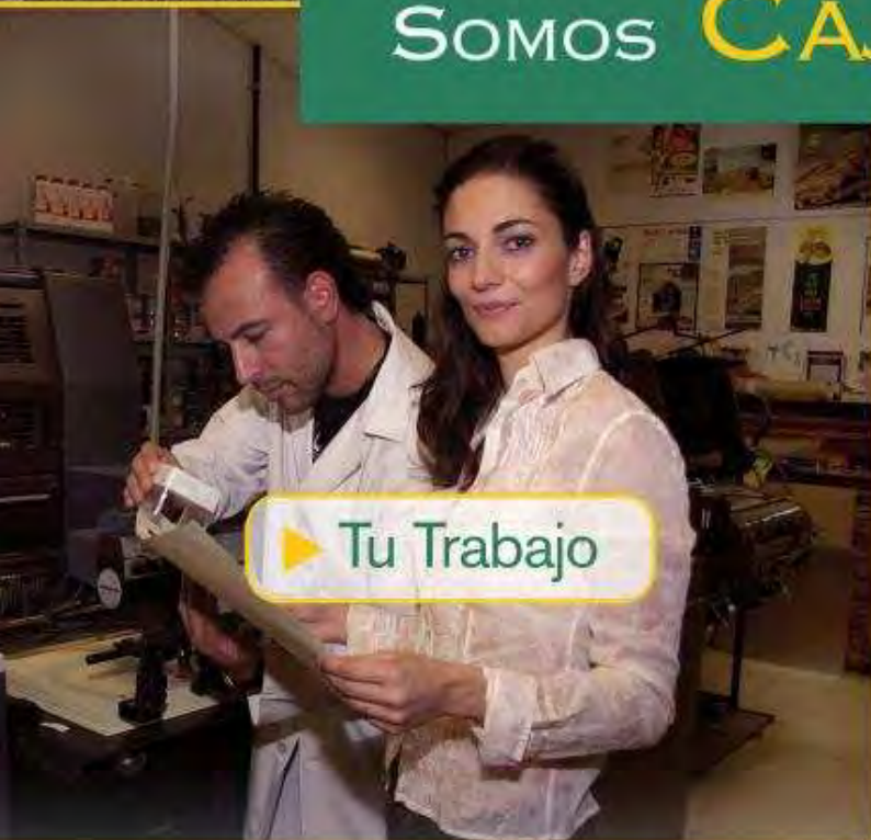
▶ Tu Trabajo