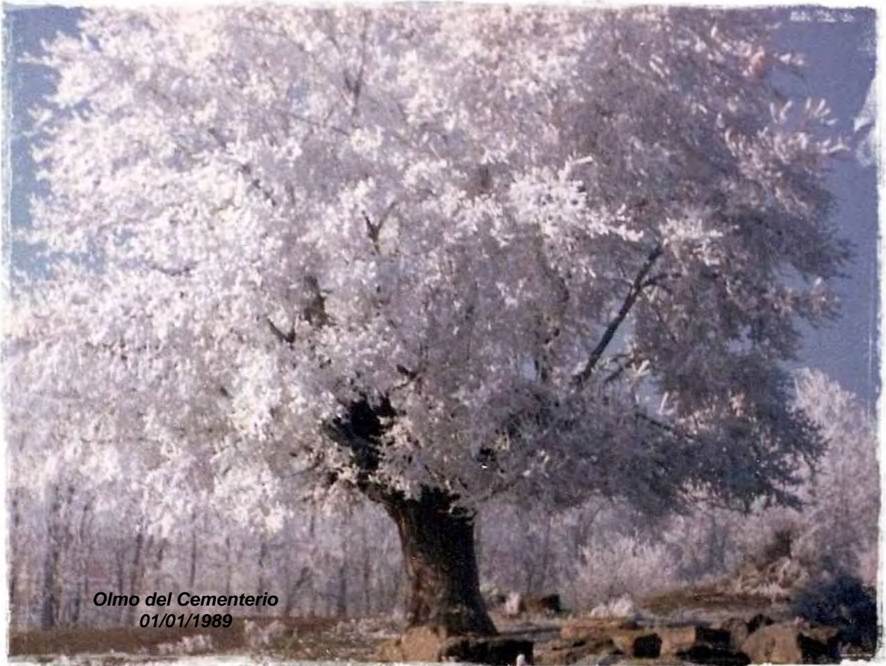
Olmo del Cementerio 01/01/1989