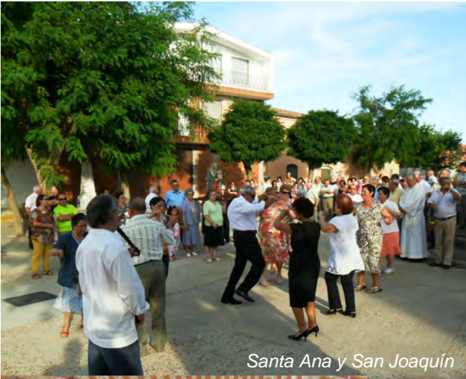
Santa Ana y San Joaquín